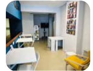
ACCUEIL INFORMATION COWORKING