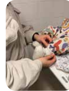
ESPACE PARENTS - BÉBÉ