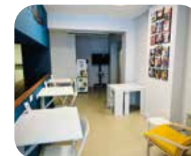
RECEPTIE INFORMATION COWORKING