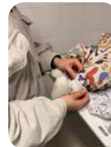
OUDERS EN BABY'S HOEK